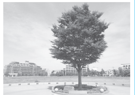
①会場となる「桃井原っぱ公園」/一面に原っぱが広がる区立公園