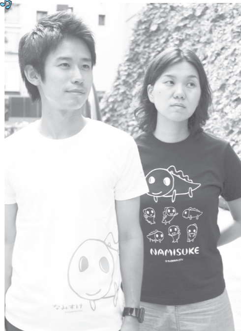
コミュかるショップオリジナルなみすけロゴ入りTシャツ好評発売中!

コミュかるショップ営業時間：月～金 9:00～16:30 問合せ：コミュかるショップ Tel: 03-3312-2111 (区役所代表)