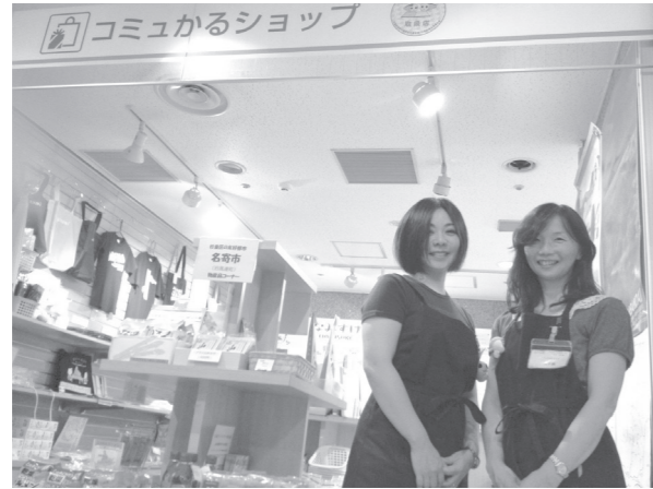
区役所内にあるコミュかるショップ

10月7日～9日は、リフレッシュを記念して「コミュかるフェア」を開催。区内の店舗と協力し、日替わりで数量限定商品を販売予定です。なみすけとナミーも応援に駆けつけてくれます。