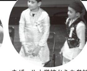
ネパール人学校からも参加