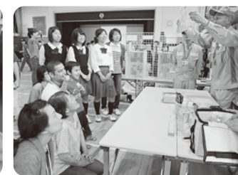
ゴミの分別クイズで間違いに気づいたこともたくさん