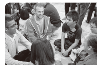
チーム毎に自己紹介をしたり意見交換