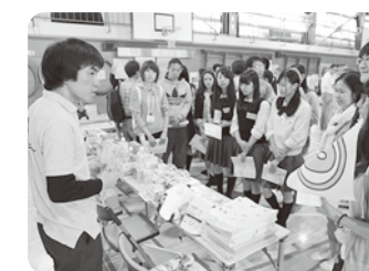
豊富な非常食の数々や便利な防災グッズの説明に納得