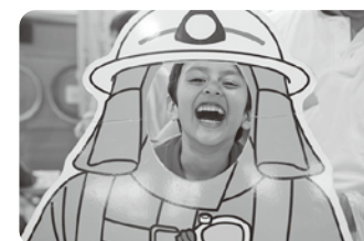
子どもたちが楽しめる心配りもあちこちに

このイベントは、杉並警察署、杉並消防署、杉並消防団、杉並区防災課、杉並清掃事務所、東京ガス(株)、丸美屋食品(株)、NPO法人すぎなみ環境ネットワーク、葛飾福祉工場のみなさんの協力を得ることにより、参加者に非常に充実した防災に関する知識や体験の機会を提供することができています。関係者が外国人の人たちに、どのようにしたら災害時に必要な情報を伝えられるかを工夫し、事前によく準備されていたのが印象的でした。