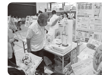
ガスメーターの復旧方法を教えてもらいました