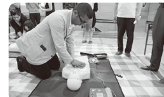
まちなかで見かけるAEDですが 使うのは初めて