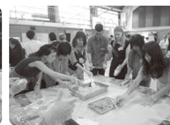
防災米(アルファ米)を使っておにぎりづくりに挑戦