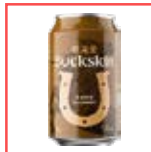
バックスキン ビール