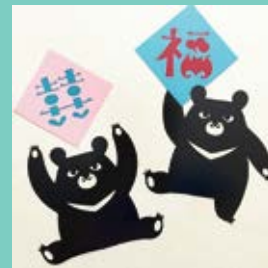
上野 文緒 うえの ふみお

台湾の書籍で中国西北地方の民間切り紙に出会い、2010年頃から独学にて中国切り紙の制作を始める。伝統的な赤い切り