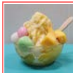
阿佐谷地域区民センター by keyaki cafe