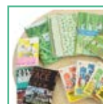
トゥーヴァージズ