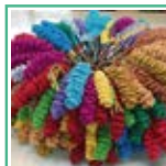
在日台湾原住民 連合会