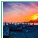
台湾世界遺産 登録応援会