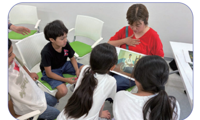
絵本活動2 「この女の人はどんな人？」