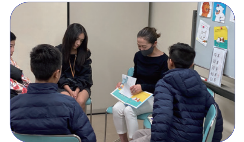
絵本活動1 「次にするのはどの子かな？」