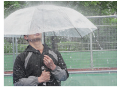
1時間に200mmの豪雨体験

バケツをひっくり返したような激しい音と水の勢いに、思わず首をすくめた豪雨体験。脱出しようとしても、水圧でなかなか開けられないドア。慣れない国に来ている在住外国人にとって、大雨が降ったらどうなるのか、どう行動したらいいのか、地域防災への関心と理解を深める良いきっかけになりました。参加した在住外国人からも「留学生として日本に来てまだ日が浅いため大雨を体験できてよかった。訓練も見られて勉強になった。雨に備えて長靴などを揃えたい。」という頼もしい感想が聞かれました。また、外国人従業員10人が参加した区内の会社の方からは、「これからも防災支援に取り組みたいし、地域住民とともに協力する機会があれば参加したい」と語っていました。(広報S)