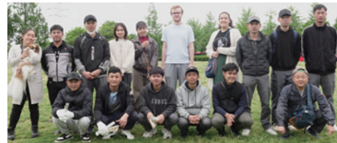
参加者と通訳ボランティア

大雨の季節に備え、5月23日(土)、「杉並区合同水防訓練」が実施され、区立下高井戸おおぞら公園に区や消防署、消防団、町会、ボランティアなど約170名が集まりました。ベトナム、インドネシア、アメリカ、カナダ国籍の杉並区在住外国人13名も「体験コーナー」で豪雨体験や水圧ドア体験、土のう積み・消火器操作を体験し、当協会ではベトナム語・インドネシア語・英語の通訳ボランティアを派遣して語学面でのサポートを行いました。