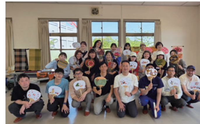
集合写真(青梅夜具地を用いて作成したうちわ)